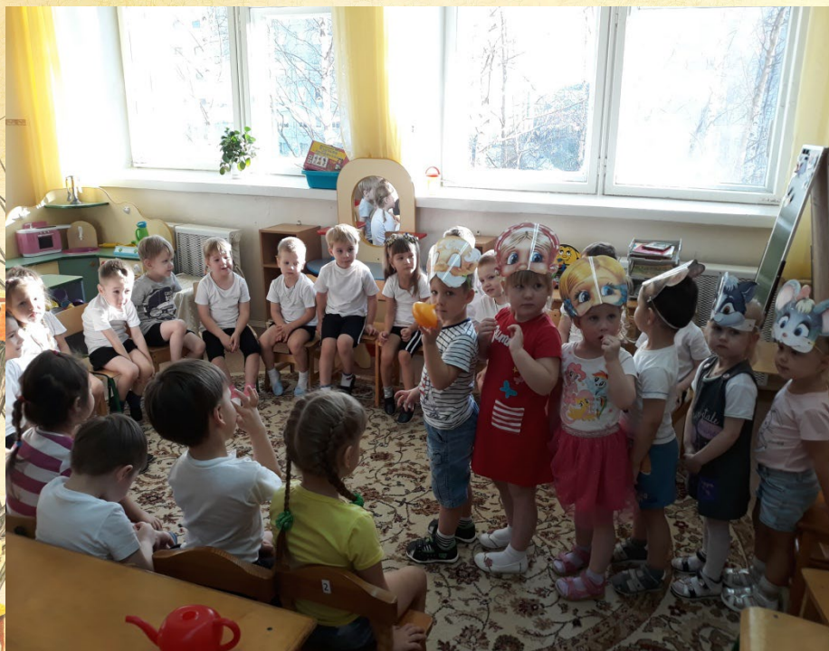
Фото выставка «Урожай на весь край!»